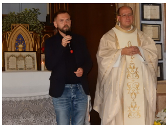
• pouť v Kašperských Horách