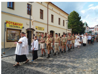
• pouť ve vatěticích