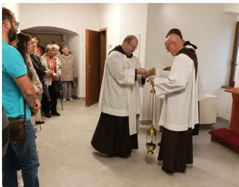
Fotografie ze žehnání nových zpovědnic