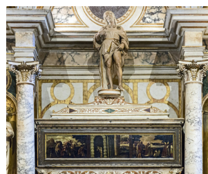
Hrob sv. Rocha v Benátkách