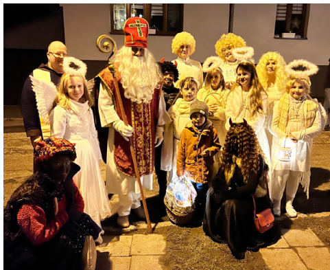
Tým sv. Mikuláše

Na Štědrý den proběhla v klášterním kostele dětská „půlnoční“ mše sv.