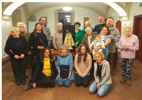
Panna Marie Svatohorská s terciářů