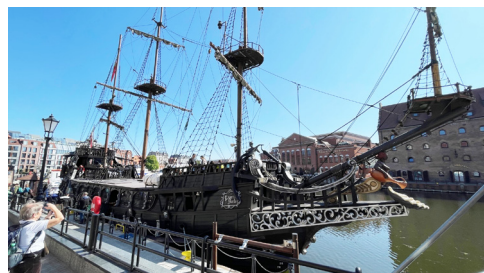
Třístěžňová loď v přístavním doku

Po snídani v hotelu jsme naložili zavazadla do autobusu a odjeli do městské části Oliwa, kde jsme navštívili katedrálu P. Marie (Katedra Oliwska) a vyslechli krátký varhanní koncert. Při krátké prohlídce chrámu jsme viděli připomínku prvního přijímání dětí po obou stranách pres-