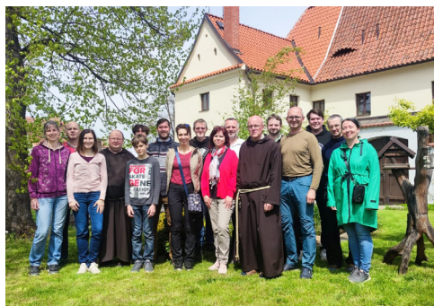
Kapucínští přátelé z Moravy