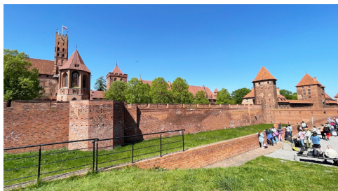
Pevnost křižáckého kláštera v Malborku

sv. Jana Pavla II. a spěchali na večeři, potom jsme měli volno.