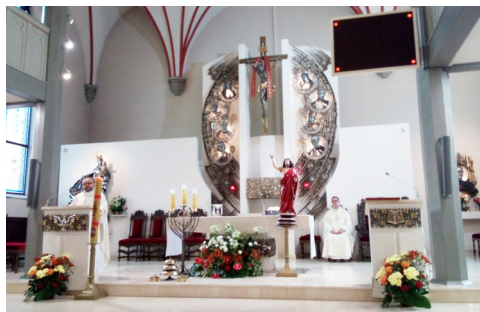
Původně protestantský kostel sv. Jana Boska

bytáře: malé překližkové postavičky andělů se jmény dětí.