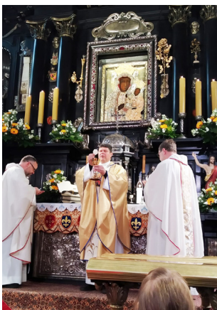
Mše sv. v kapli P. M. Čenstochovské

Potom jsme se společně modlili křížovou cestu na hradbách a ještě si prohlédli klenotnici, která obsahuje různé dary pro toto poutní místo. Po společné fotce u sochy Jana Pavla II. jsme měli rozchod pro osobní modlitbu, procházku a občerstvení. Ve 14 h