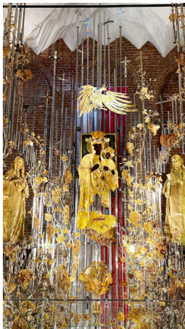
Jantarový oltář v kostele sv. Brigity Švédské

Kousek před Gdaňskem jsme zastavili na večeři, kterou pro nás připravili přátelé P. Roberta, po které jsme jim na poděkování zazpívali několik českých národních písní. V Gdaňsku jsme se ubytovali v hotelu a ráno jsme začínali v 7 h mší sv. v kostele sv. Brigydy (Brigity Švédské), kde už 14 let postupně dotvářejí jantarový oltář, vše z darů dobrodinců z celého světa. Oltář je tvořen za zlata, stříbra a 840 kg jantaru. Po snídani v hotelu jsme přešli autobusem k přístavu a odtud jsme vypluli třístěžňovou lodí na hodinovou vyjízdku podél přístavních doků, kde jsme měli i veliké zaoceánské lodě a také místo Westerplatte, kde 1. září 1939 začala druhá