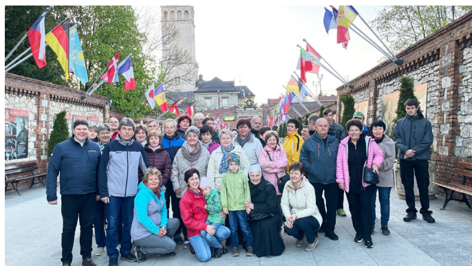
Společná fotografie poutníků

v Evropě a dvanáctá na světě). Byla postavena během deseti let, při stavbě se nestal žádný úraz a vše bylo uhrazeno z darů mnoha lidí. Z věže vysoké 142 m je rozhled do širokého okolí. Po večeři jsme se vydali na Golgotu, která je vystavěna z velkého množství různých kamenů (i barevných). Úzká cesta směřuje pozvolna vzhůru a prochází se skrze malé brány, kde jsou zobrazena jednotlivá zastavení křížové cesty. Na vrcholu této uměle vystavěné hory je docela velké prostranství