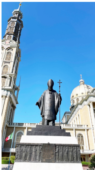
Památník Jana Pavla II.

Ve čtvrtek jsme v kapli toho domu měli ráno v 7 h mši sv., naložili jsme zavazadla do autobusu a po snídani odjeli do centra na prohlídku historické části města. Viděli jsme divadlo, kostel P. Marie, křivou věž, katedrálu sv. Janů (Křtitele a evangelisty) a také pomník i dům místního rodáka Mikuláše Koperníka. Na oběd jsme zajeli zpět do poutního domu a potom se vydali na poutní místo v obci Licheň Stary (poblíž města Konin). Tam jsme dorazili kolem 15. hodiny. Po ubytování jsme prošli s průvodkyní část rozlehlého areálu a také baziliku (největší v Polsku, osmá