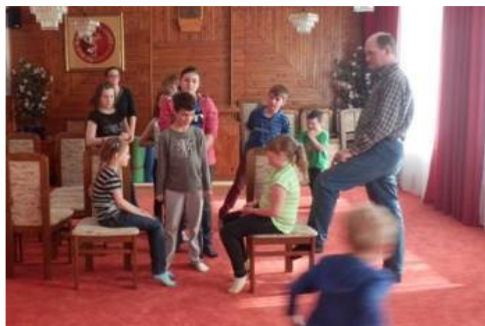
6. Velikonoční oslava v Kolinci – dětský klub