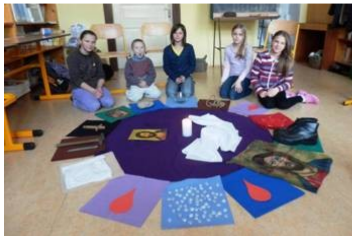
4. Křížová cesta v hodině náboženství ve škole na Kašperských Horách.