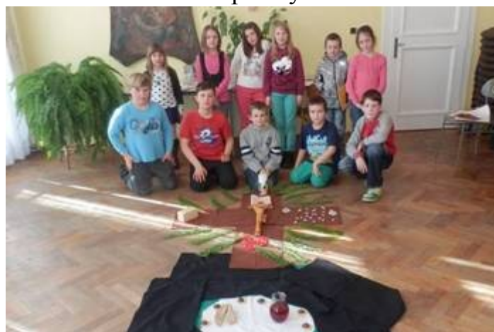
5. Jdeme s Ježíšem křížovou cestu – děti z přípravy Sušice