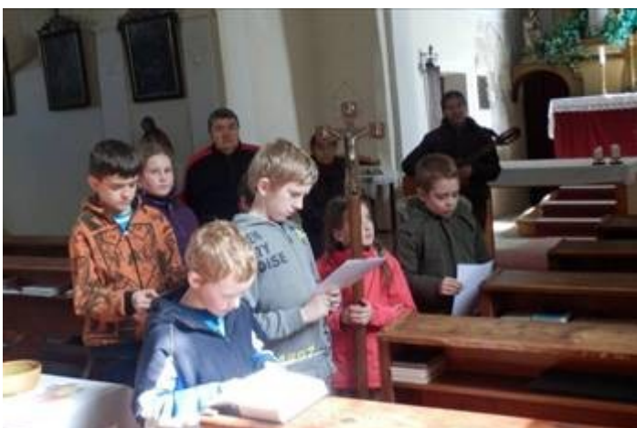
2. Křížová cesta v hodině náboženství – kostel v Dlouhé Vsi.