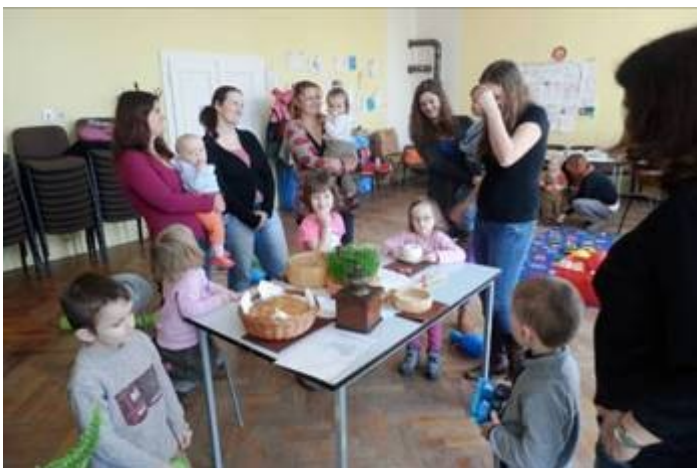
1. Tajemství obilného zrnka – setkávání maminek s dětmi v Sušici

Další fotografie najdete na webových stránkách sušické farnosti.