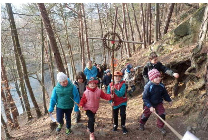
3. Křížová cesta s dětmi na Andělíček v Sušici.