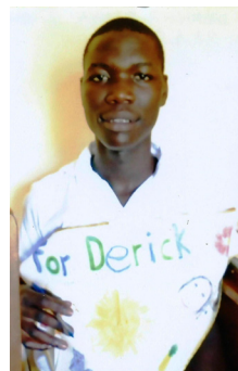
Derick z Ugandy (18 let)

studuje na vysoké škole obor zdravotní sestra a pomáháme jí od roku 2004