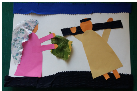
aktuální zastavení křížové cesty Veronika podává Pánu Ježíši roušku