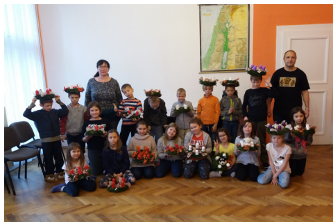
adventní přespávání dětí na faře