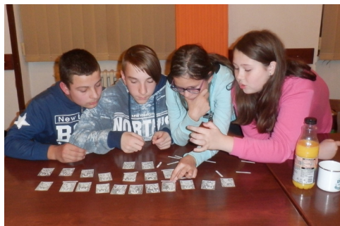
24 hodin v klášteře