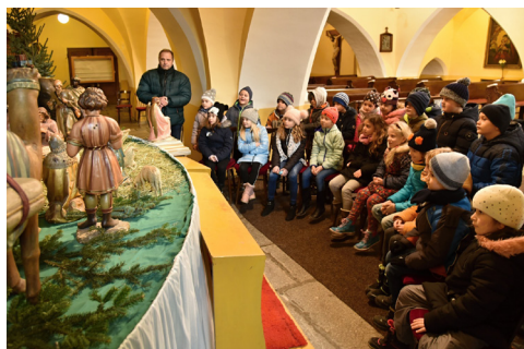
katecheze pro školáky u jeslíček