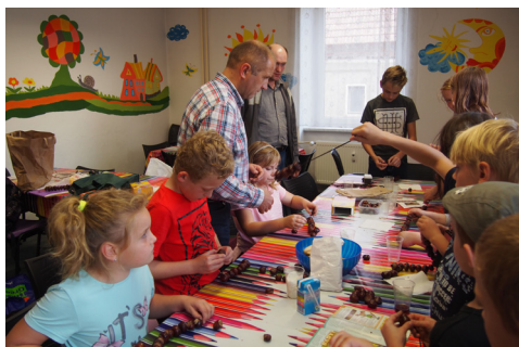
s dětmi v Kolinci