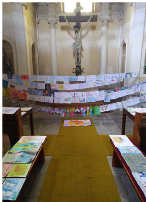
vystavení kreseb u kapucínů

V době, kdy nebyly možné návštěvy v nemocnicích, přišel nápad zprostředkovat špetku radosti pacientům v Sušici. Jak? Pastelkou, tužkou, fixem, barvami, lepidlem, nůžkami..., prostě nějakým obrázkem. A úsměvné je, že to všechno vzniklo tak trochu omylem.