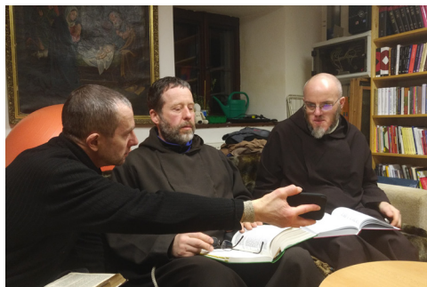
foto ještě ze sušického kláštera