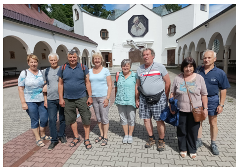
Poutníci v Mariahilf ve Zlatých Horách

Začátkem července jsme se vypravili do Orlických hor navštívit poutní místa, která neznáme nebo jen málo, a viděli jsme je v televizi Noe. Cestou jsme se zastavili v kostele sv. Jana Nepomuckého