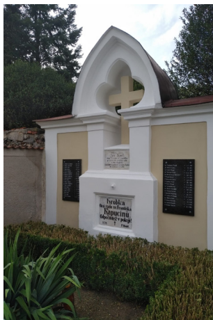
Sušická kapucínská hrobka