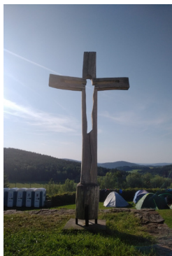
Dřevěný kříž na zahradě u domu DCM