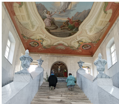
Svaté schody v kapli na Hoře Matky Boží u Králík

na Zelené hoře u Žďáru nad Sázavou. Pak jsme pokračovali do Rychnova nad