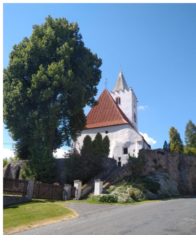
Kostel sv. Petra a Pavla v Petrovčích