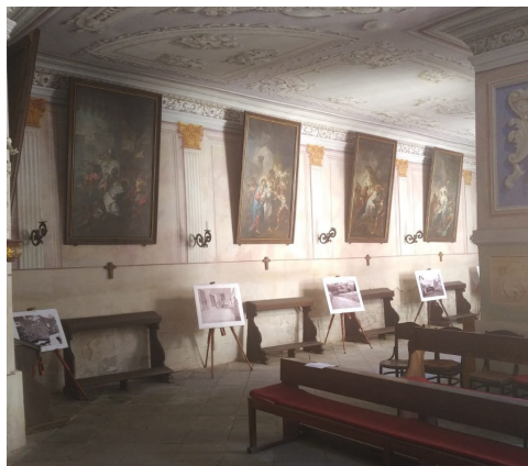
Křížová chodba opočenského kláštera