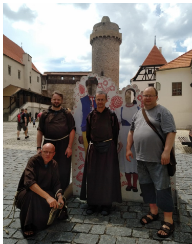
Společná fotografie na hradním nádvoří