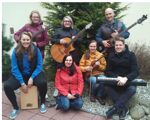
Chválová skupina Chevra

V úterý 28. 3. se u nás sejde provinciál se svou radou, pravděpodobně se budou zamýšlet i nad možným vymalo-