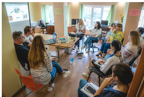
Charitní školení ukrajinských psychologů v krizové intervenci

V praxi se setkáváme s problémy např. u invalidních a postižených osob, protože se na ně zatím nevztahuje naše legislativa pro tuto oblast. Řešíme často také naplněnou kapacitu pro přijímání nových pacientů u obvodních a dětských lékařů, velkým problémem je i nedostatek stomatologů.