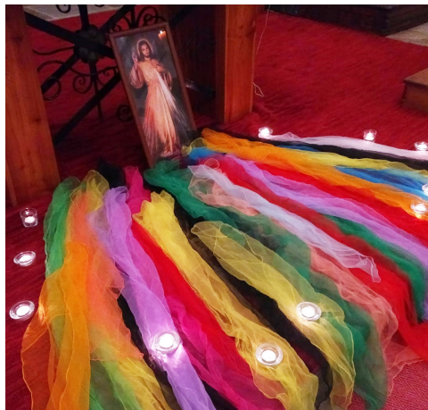
24 h v klášteře – katecheze před svátostí smíření