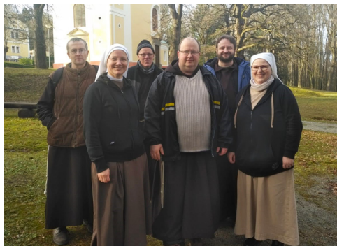
Společná fotografie na Lomci

Večer před Popeleční středou nás mile překvapil chlapský farní „fašank“ Na Bouchalce. Děkujeme! A večer 22. 2. se